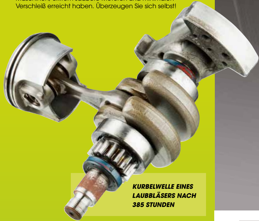
KURBELWELLE EINES LAUBBLÄSERS NACH 385 STUNDEN

Wir können jetzt bestätigen, dass wir unser Ziel nach einem umfangreichen Feldtest mit Tausenden von Maschinen, extrem saubere Motoren und minimalen Verschleiß erreicht haben. Überzeugen Sie sich selbst!