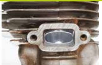
AUSLASSÖFFNUNG EINER KETTENSÄGE NACH 355 STUNDEN