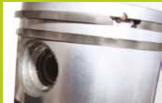
KOLBEN EINES HECKEN- SCHNEIDERS NACH 30-MONATIGER TESTPHASE